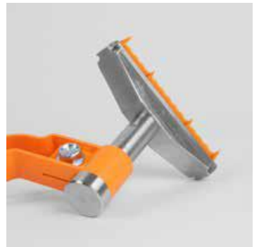
obrotowy element wbijaka