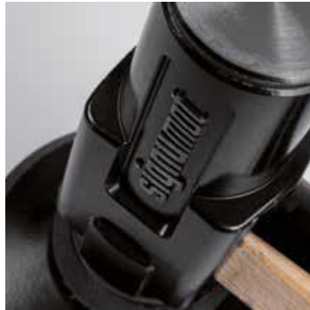
Jakość stali kutej